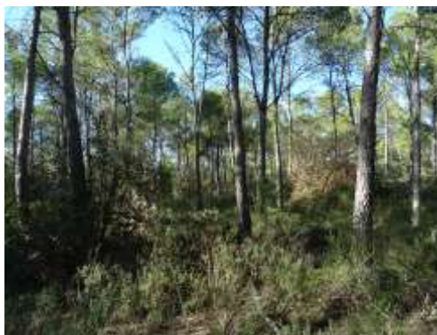
Figura 1. Parcela del municipio de Vilopriu (Provincia de Girona). Año 2016.

La Figura 2 muestra la localización de las explotaciones ganaderas que forman parte del proyecto. Destacan dos clústeres principales dentro de la provincia: la sierra de Gavarres en el sur y la Albera en el norte, cerca de la frontera con Francia.