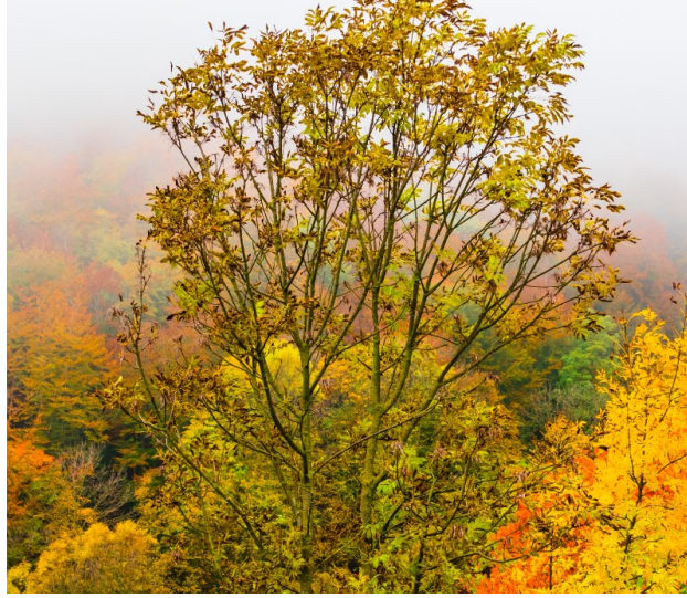
Figura 2. Ejemplo de fotografía ( Franklin Gothic Book 9 cursiva, centrado )