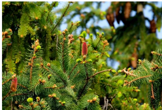
Figura 2. Ejemplo de fotografía (Franklin Gothic Book 9 cursiva, centrado, espaciado anterior y posterior de 6 ptos.)